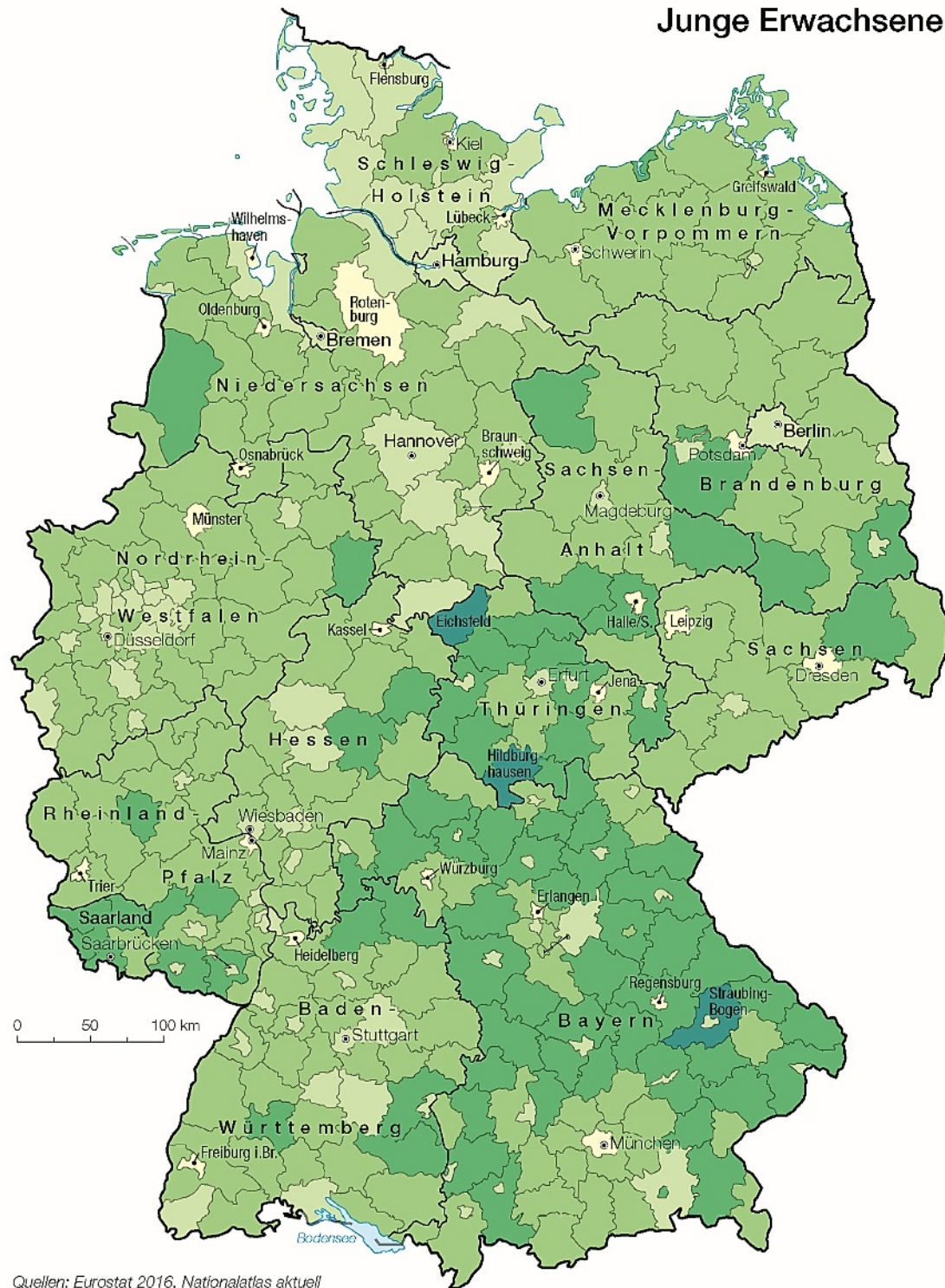
Anteil der 25- bis 29-Jährigen, die im Haushalt der Eltern leben nach Kreisen in %